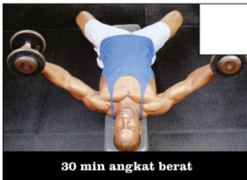
30 min angkat berat