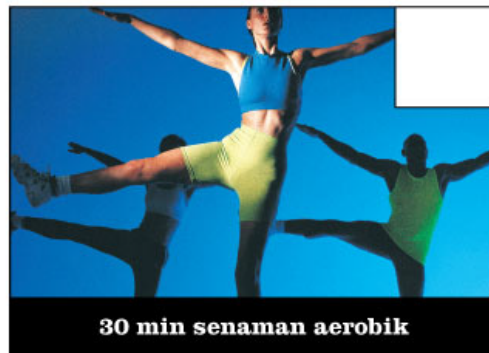
30 min senaman aerobik