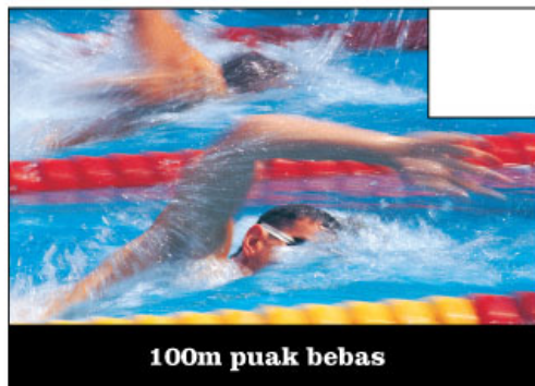
100m puak bebas

Lengkapkan borang peraduan, karang slogan yang paling kreatif dan hantarkannya bersama penutup Botol Red Bull sebagai bukti pembelian. Anda berpeluang memenangi hadiah-hadiah sehingga RM100,000.