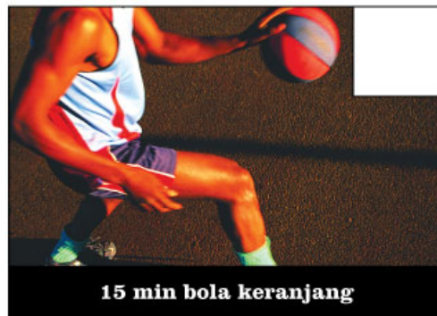
15 min bola keranjang