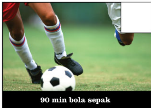
90 min bola sepak